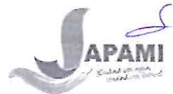
PEDRO ALAMILLO SOTO PRESIDENTE DEL CONSEJO DIRECTIVO